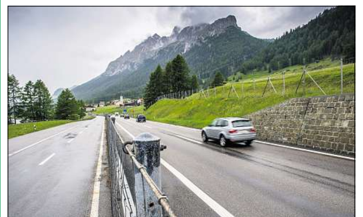
Tge mesiras ch'ins vul prender per sminuir il dumber d'accidents sin la A13 sper Sufers n'è anc betg cler.